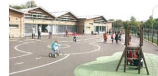
la cour de récréation