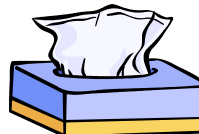
2 boîtes de mouchoirs