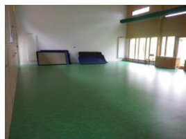
la salle de motricité