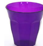
1 verre à mon nom